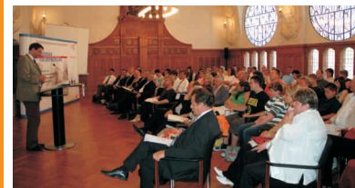
Festansprache des Kultusministers

Auszüge aus den Laudationes lesen Sie auf der Seite 2.