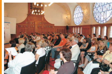
Großes Interesse am Berufswahl-SIEGEL