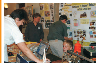
SIEGEL-Schulen aus dem Vorjahr zeigen ihre Aktivitäten zur Berufswahlorientierung