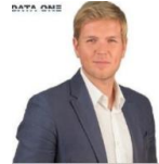
Kai Madsack Data One