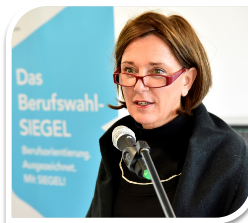
SIEGEL-Schirmherrin in NRW: Schulministerin Yvonne Gebauer